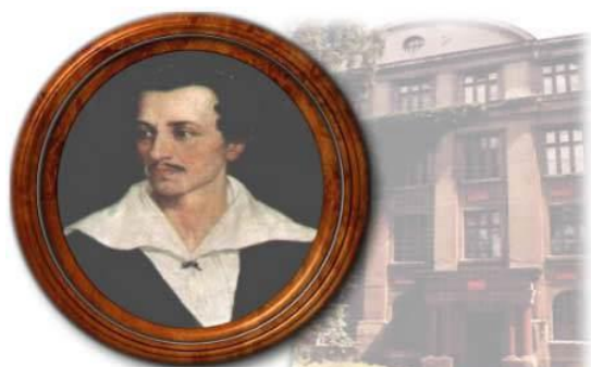
I Liceum Ogólnokształcące im. Juliusza Słowackiego w Częstochowie